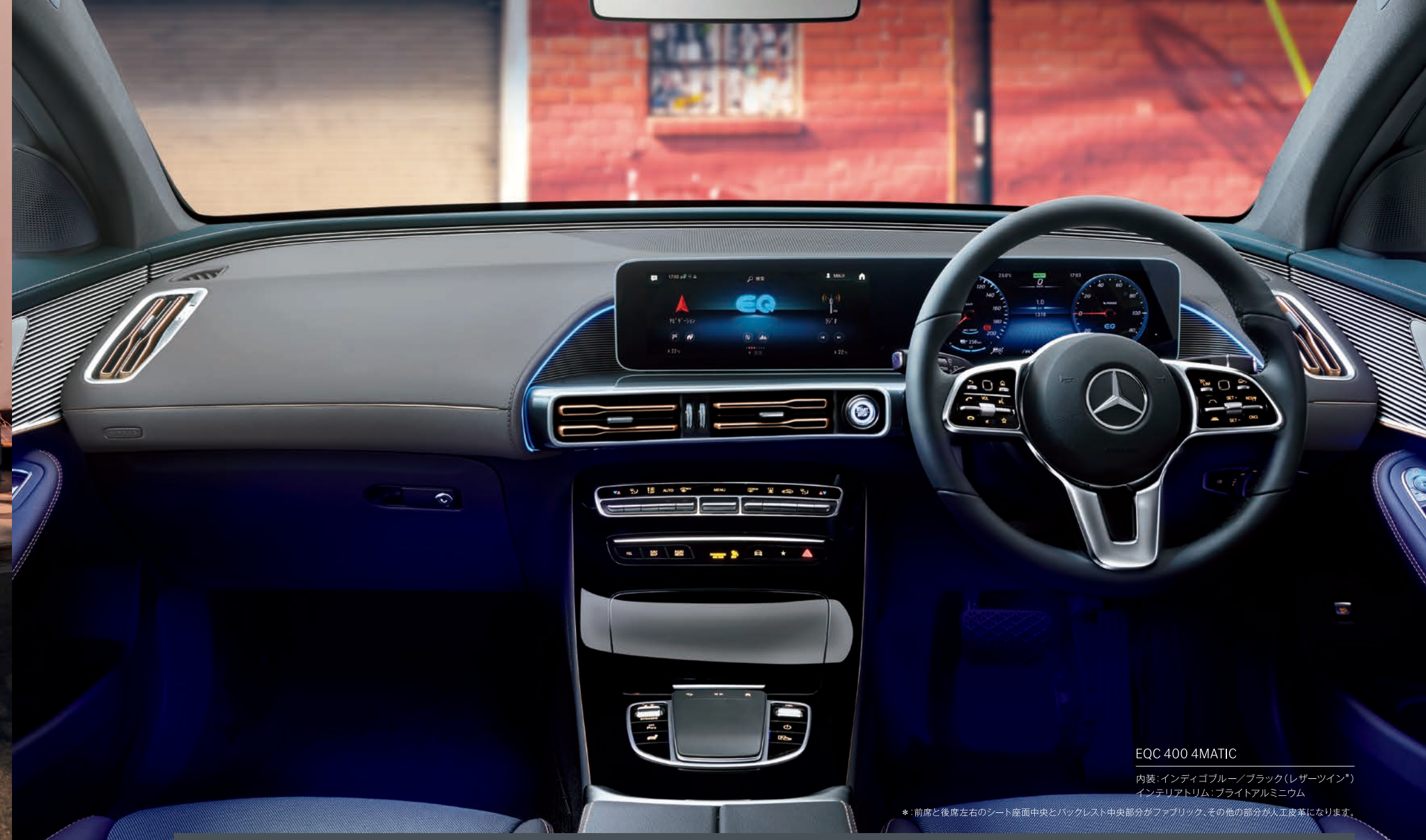
EQC 400 4MATIC

※日本仕様の充電口は2箇所あり、充電用ウォールユニット用の充電口（普通充電用ポート）はリアバンパー右側に配置され、CHAdeMO用の充電口（急速充電用ポート）はリアフェンダーに配置されています。