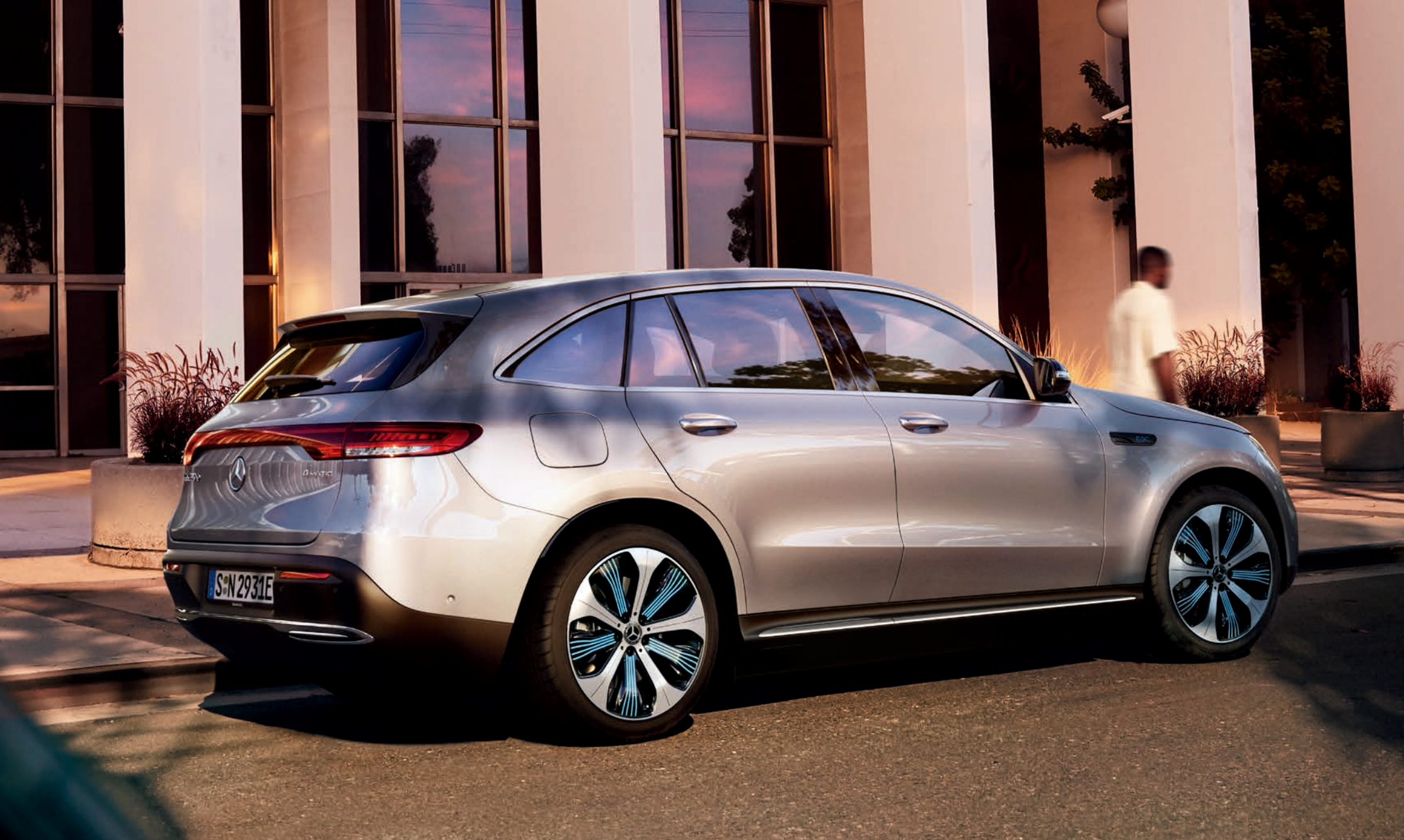
EQC 400 4MATIC