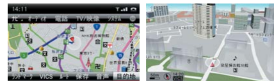
ナビゲーション画面