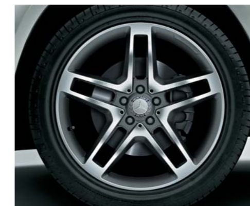
チタニウムグレーペイント 20インチAMG5ツインスポークアルミホイール