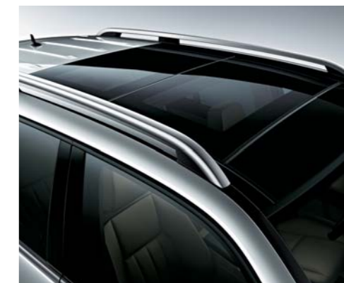
パノラミックスライディングルーフ（挟み込み防止機能付）