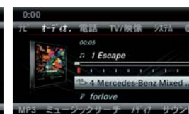
カバーアート表示