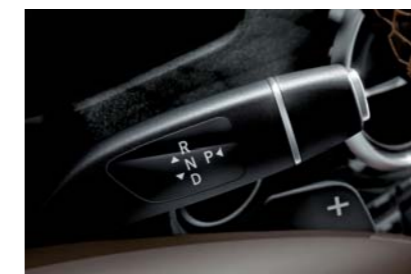
DIRECT SELECT(ダイレクトセレクト)