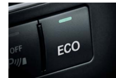
ECOスタートストップ機能