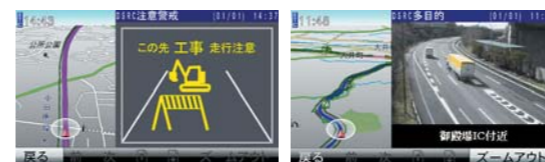
ITSスポットサービスによる交通状況表示