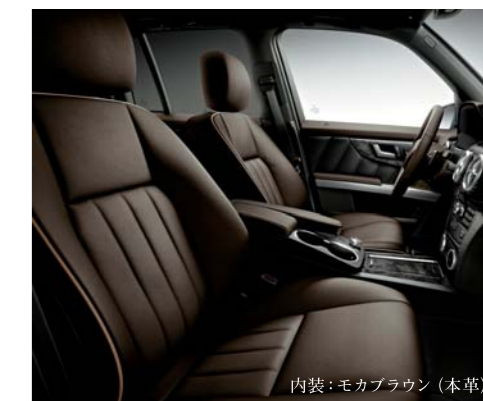
内装：モカブラウン（本革） 本革シート【前席シートヒーター付】

※装備についての詳細は、The new GLK-Class Data Information（別冊）をご覧ください。またはメルセデス・ベンツ正規販売店にお問い合わせください。