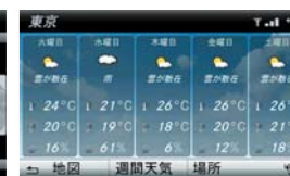
インターネット接続による天気情報