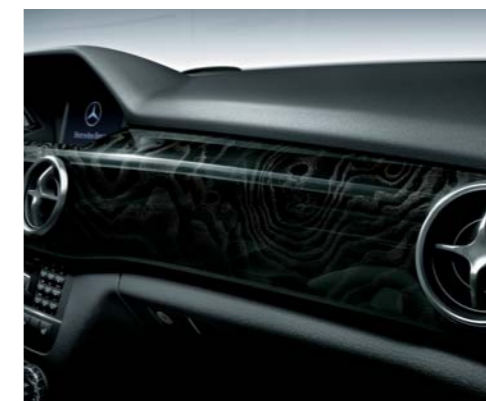
ブラックアッシュウッドインテリアトリム