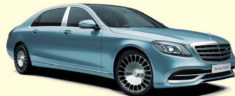
988 ダイヤモンドシルバー