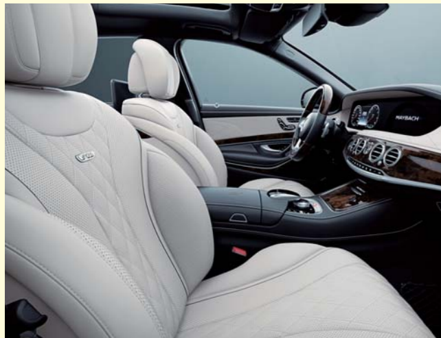
515 ポーセレン/ブラック