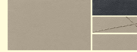
965 シルクベージュ/チタニウムグレーパール