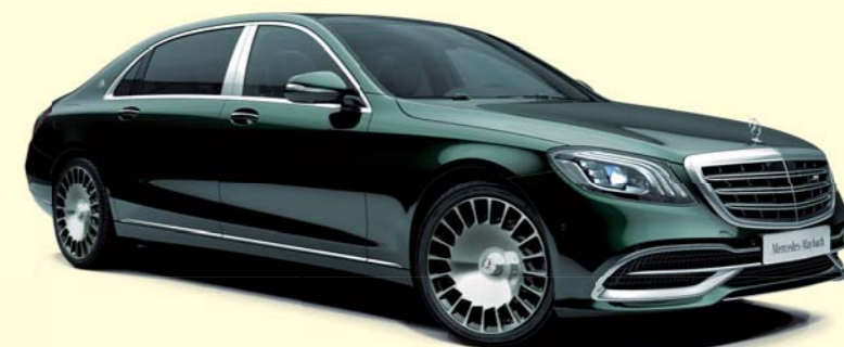
989 エメラルドグリーン