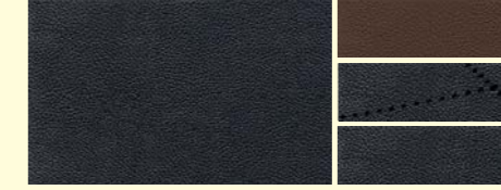
518 マグマグレー/エスプレッソブラウン