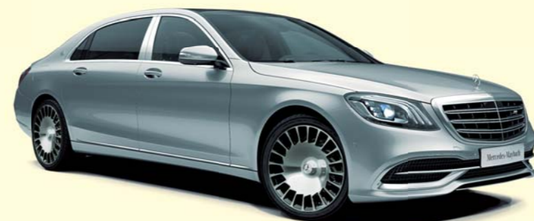
775 イリジウムシルバー