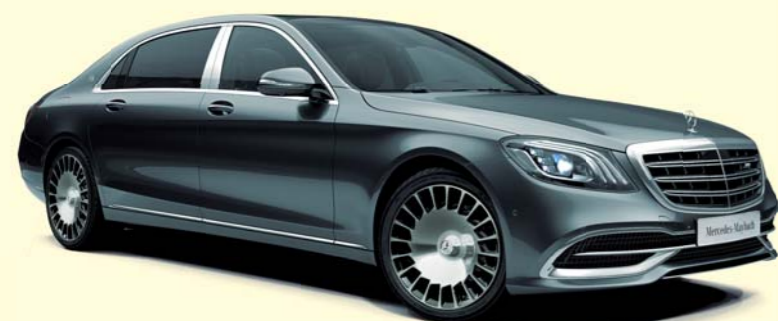
992 セレナイトグレー