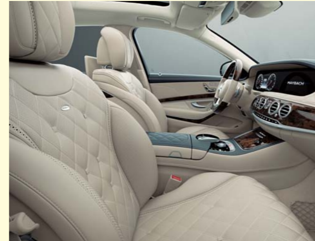
962 シルクベージュ/ディープシーブルー