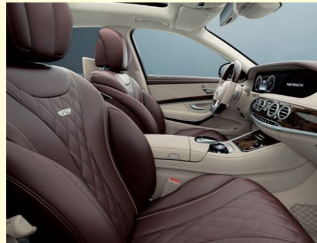
524 マホガニー/シルクベージュ