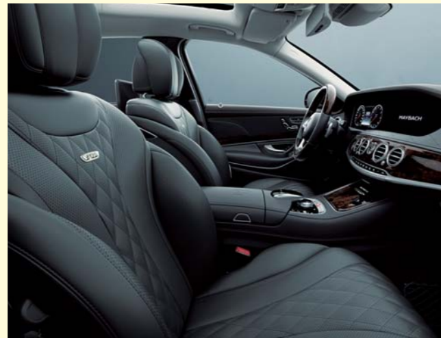
518 マグマグレー/エスプレッソブラウン