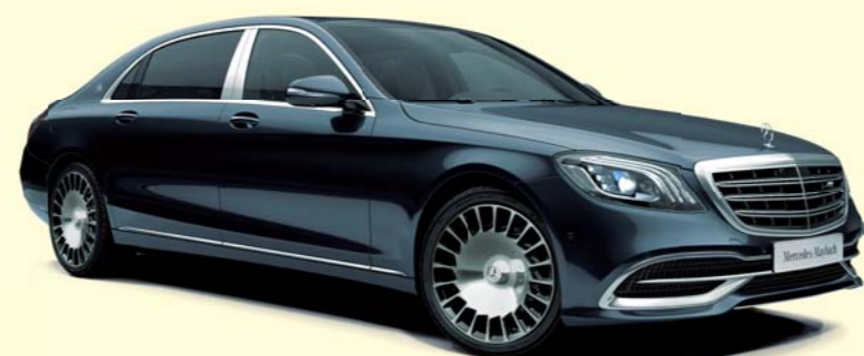
998 アンスラサイトブルー

その別格の佇まいを彩る、10種類のボディカラー。 個性を表現する、10種類のボディカラーをご用意しました。