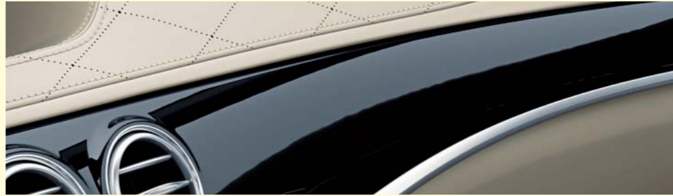
designoピアノラッカーウッド