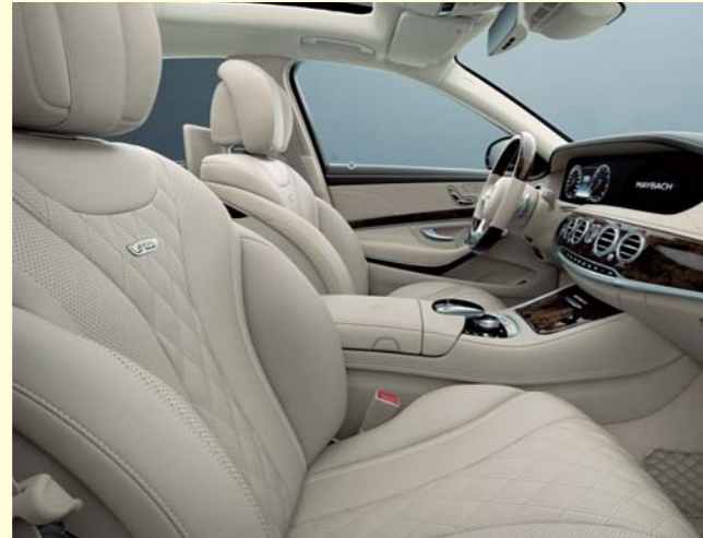
505 シルクベージュ/エスプレッソブラウン