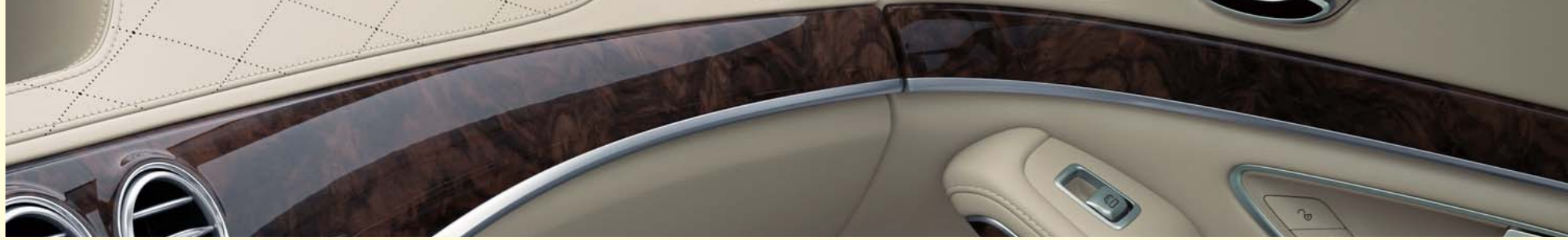
ブラウンハイグロスウォールナットウッド