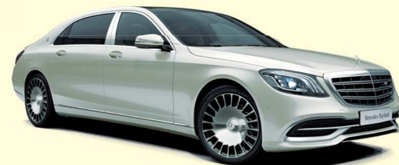
799 ダイヤモンドホワイト(有償)