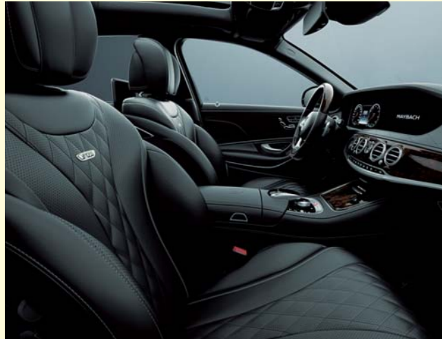
501 ブラック/ブラック