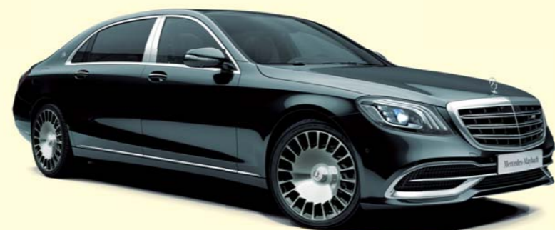
197 オブシディアンブラック