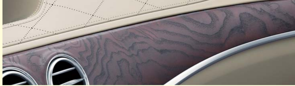
designoブラウンアッシュウッド