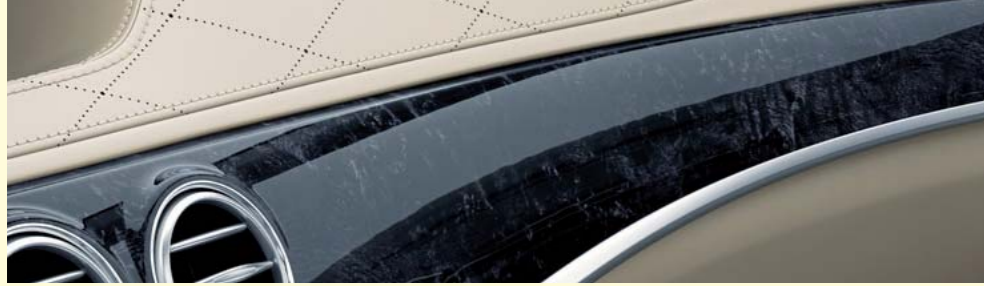
ブラックハイグロスボブラウッド