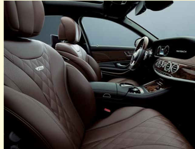
514 ナッツブラウン/ブラック