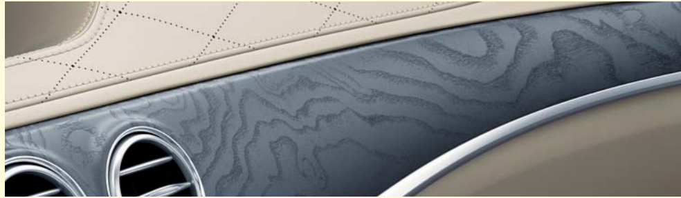
designoブラックアッシュウッド