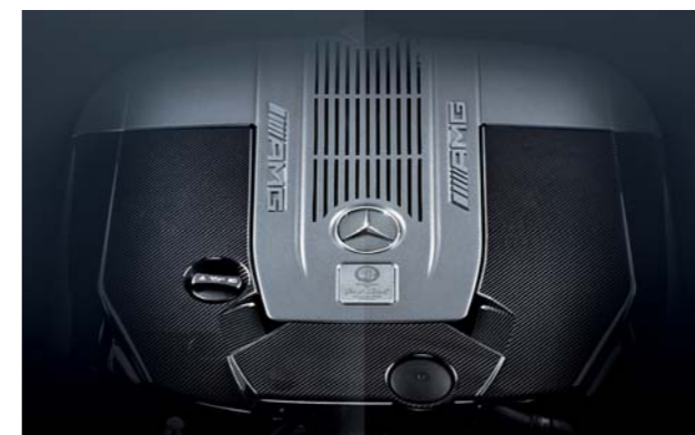
6.0ℓ V型12気筒ツインターボエンジン