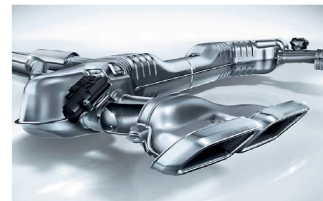
AMGスポーツエグゾーストシステム