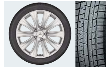
ウィンタータイヤ&ホイールセット

雪道や凍結路走行時に必要なウィンタータイヤです。冬のドライブに備えてオススメのアイテムです。 ※写真はイメージです。 ※ホイールのデザインは変更になる場合があります。 ※サイズ、価格などの詳細につきましては、メルセデス・ベンツ正規販売店までお問い合わせください。