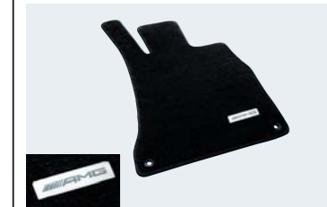
AMGフロアマット プレミアム

ボリューム感が魅力のフロアマットです。室内の高級感を高め、より快適な空間を演出。消臭機能や、防汚機能も備えています。フロント左右とリア左右の4点セット。AMGロゴメタルプレートが付き、スポーティなシルバーステッチがあしらわれています。