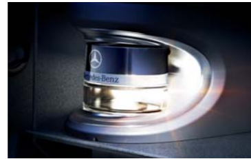
パフュームアトマイザー

エアバランスパッケージのパフュームアトマイザー交換用リフィルです。Sクラス カブリオレの空間を、洗練されたオリジナルの香りが包み込みます。ドライブシーンや気分にあわせて、5つの香りからお選びいただけます。 ※写真の取付車両は実際と異なります。