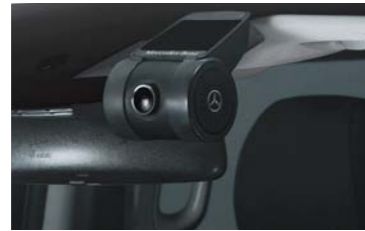
ドライブレコーダー

万が一のときの安心材料になり、安全意識も高めるドライブレコーダー。高感度CMOSセンサーで夜間でもくっきりと録画。記録した映像は専用ビューワでGPSに基づいた走行軌跡と同時に確認ができます。 ※実際の仕様と異なります。 ※写真の取付車両は実際と異なります。