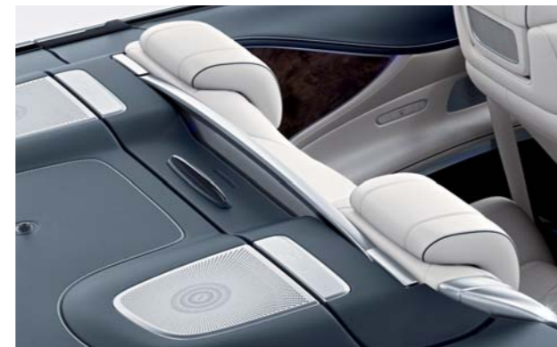
オートマティックロールバー

走行中、車両が横転する危険性などをセンサーが感知すると、通常は後席後方に格納されているロールバーが瞬時に自動的に上昇。高強度のAピラーとともに、横転時などに乗員の安全空間を確保します。また、通常時はカプリオレのインテリアに美しく溶け込むデザインを採用しています。