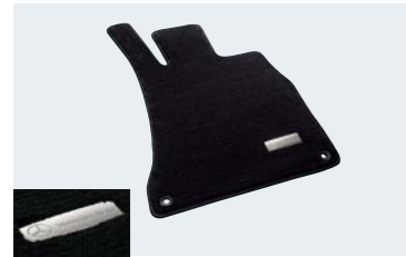
フロアマット プレミアム

官能に満ちたスタイルと、快適性あふれる車内をさらに輝かせる、上質で高機能の純正アクセサリをご用意しました。あなただけの、あなたに最上のメルセデスを、ぜひお仕立てください。