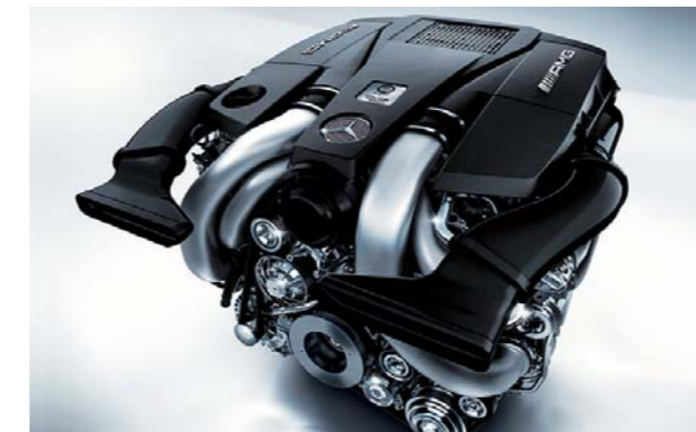
5.5ℓ V型8気筒直噴ツインターボエンジン

ツインターボチャージャー、大型インタークーラー、常に理想的な吸排気を行う電子制御可変吸気バルブタイミングと高効率な燃料噴射を実現するピエゾインジェクター、軽量化を図ったアルミ製クランクケースなど、数々の革新技術を搭載。最高出力430kW(585PS)/5,500rpm、最大トルク900N・m(91.8kg・m)/2,250~3,750rpmを達成しました。さらに、先進のエンジンマネジメントシステムや、ECOスタートストップ機能(アイドリングストップ機能)などにより大幅な低燃費性も実現し、欧州排ガス規制EU6もクリア。ハイパフォーマンスと環境適応性を高いレベルで両立しています。