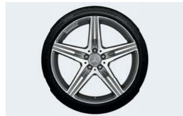
AMG20インチ5スポークアルミホイール

洗練のデザインを施した専用アルミホイール。Mercedes-AMGの厳しい規準をクリアした高い耐久性と安全性を備えています。 ※タイヤ、ホイールボルト、エアバルブ、ハブキャップは含まれません。 ※ホイール装着にはタイヤ交換が必要な場合があります。 ※記載の価格はホイール1本分の価格になります。 ※一部取付できない車両があります。