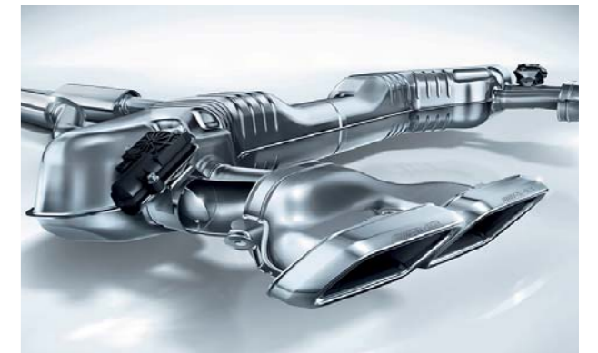
AMGスポーツエグゾーストシステム