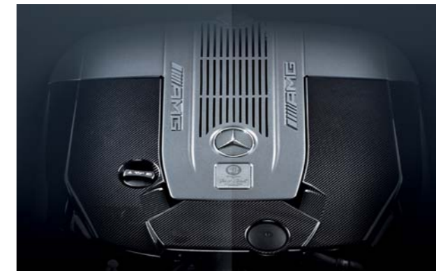
6.0ℓ V型12気筒ツインターボエンジン

高過給圧を常に適正に実現するターボチャージャー、吸気効率を高める大型の水冷式インタークーラー、デュアルイグニッション方式によるマルチスパークイグニッションシステムなどAMGの粋を結集。燃費を大幅に高めながら、1,000N・m(102.0kg・m)の最大トルクと、463kW(630PS)という驚異的な最高出力を発生。AMG最高峰ならではの静粛にしてなめらかなパワーフィールと、想像を絶するパフォーマンスを発揮します。さらに、変速比幅の広い7速A/T、AMGスピードシフトプラスや、ECOスタートストップ機能とともに優れた環境性能も実現しています。