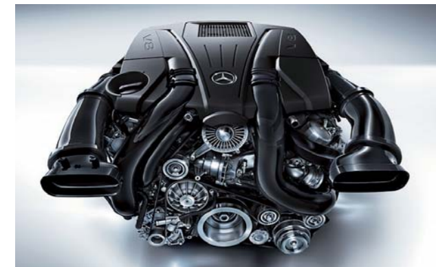
4.7ℓ V型8気筒ツインターボBlueDIRECT(ブルーダイレクト)エンジン

先進の直噴システムを用いたBlueDIRECT(ブルーダイレクト)テクノロジーを採用。10.5という高圧縮比に加え、綿密な燃料噴射を行う先進のピエゾインジェクターを搭載。さらには、MSI(マルチスパーク・イグニッション)システム、ツインターボチャージャーなど、数々の最先端技術の採用により、従来の自然吸気エンジンより大幅なダウンサイジングを図りながらも、最高出力335kW(455PS)、最大トルク700N・m(71.3kg・m)のハイパワーを達成。また、交差点などでの停車時に無駄な燃料消費を抑えるECOスタートストップ機能も採用。パフォーマンスと環境性能の両立を図っています。