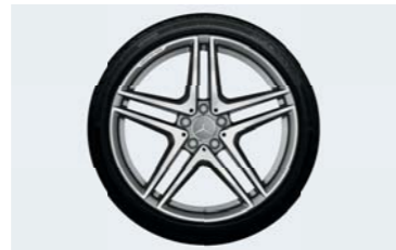
AMG20インチ5ツインスポークアルミホイール(鍛造)

フロント用 8.5J×20 ET38.245/40 R20 129,600円 リア用 9.5J×20 ET38.275/35 R20 135,000円