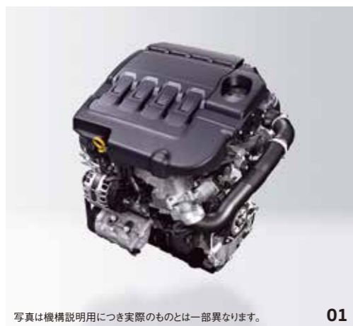
写真は機構説明用につき実際のものとは一部異なります。