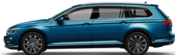
Aquamarine Blue Metallic アクアマリンブルーメタリック (8H)*