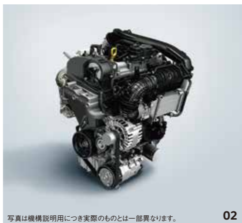
写真は機構説明用につき実際のものとは一部異なります。