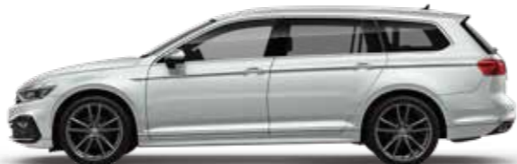
Glacier White Metallic グレイシアホワイトメタリック (2Y)