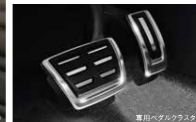
専用ペダルクラスター