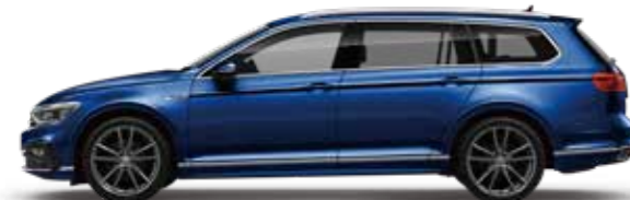
Lapiz Blue Metallic ラピスブルーメタリック (L9)*