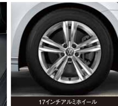
17インチアルミホイール