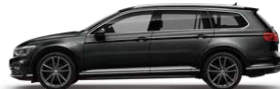
Deep Black Pearl Effect ディープブラックパールエフェクト (2T)