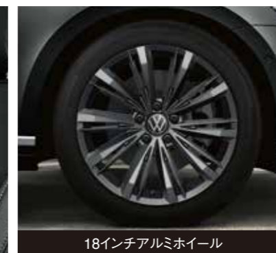
18インチアルミホイール