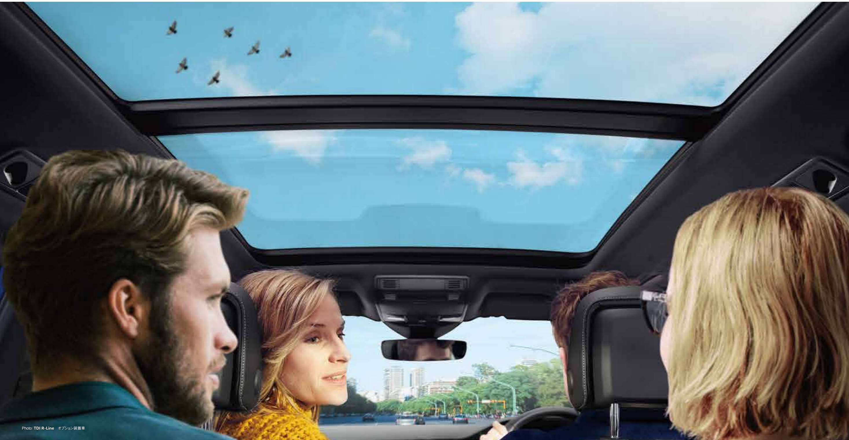
Photo: TDI R-Line オプション装着車