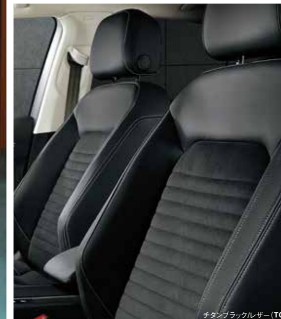
チタンブラックレザー (TO)