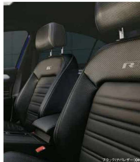
ブラックナビレザー (OH)