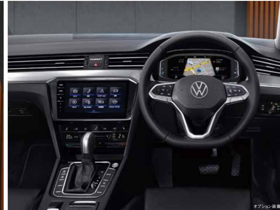
オプション装着車