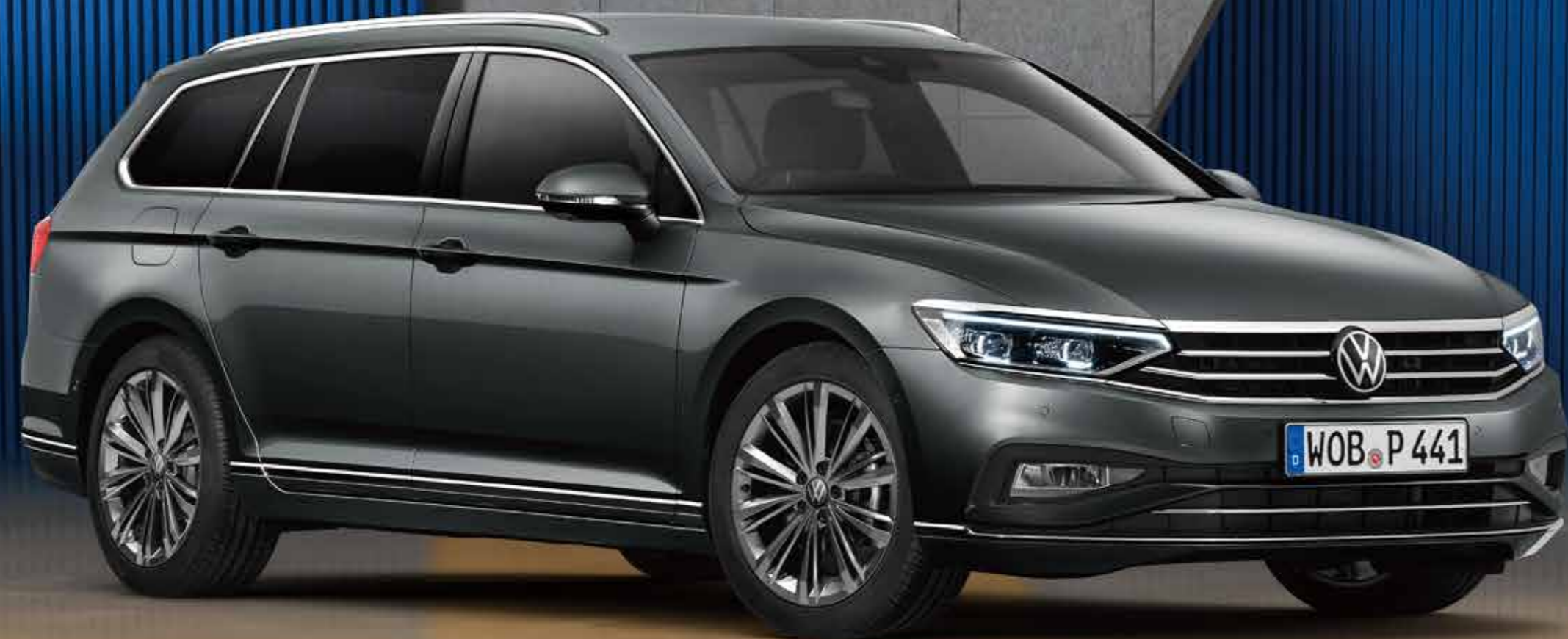
チタンブラック/ナバレザー (TO)

パワフルでクリーンなディーゼルエンジンを搭載したTDI ® 、2つのモデルをラインアップしています。