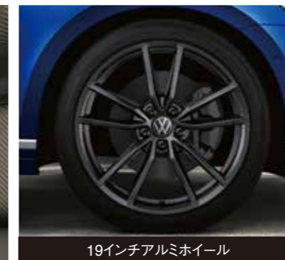
19インチアルミホイール