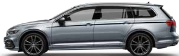
Pyrit Silver Metallic パイライトシルバーメタリック (K2)