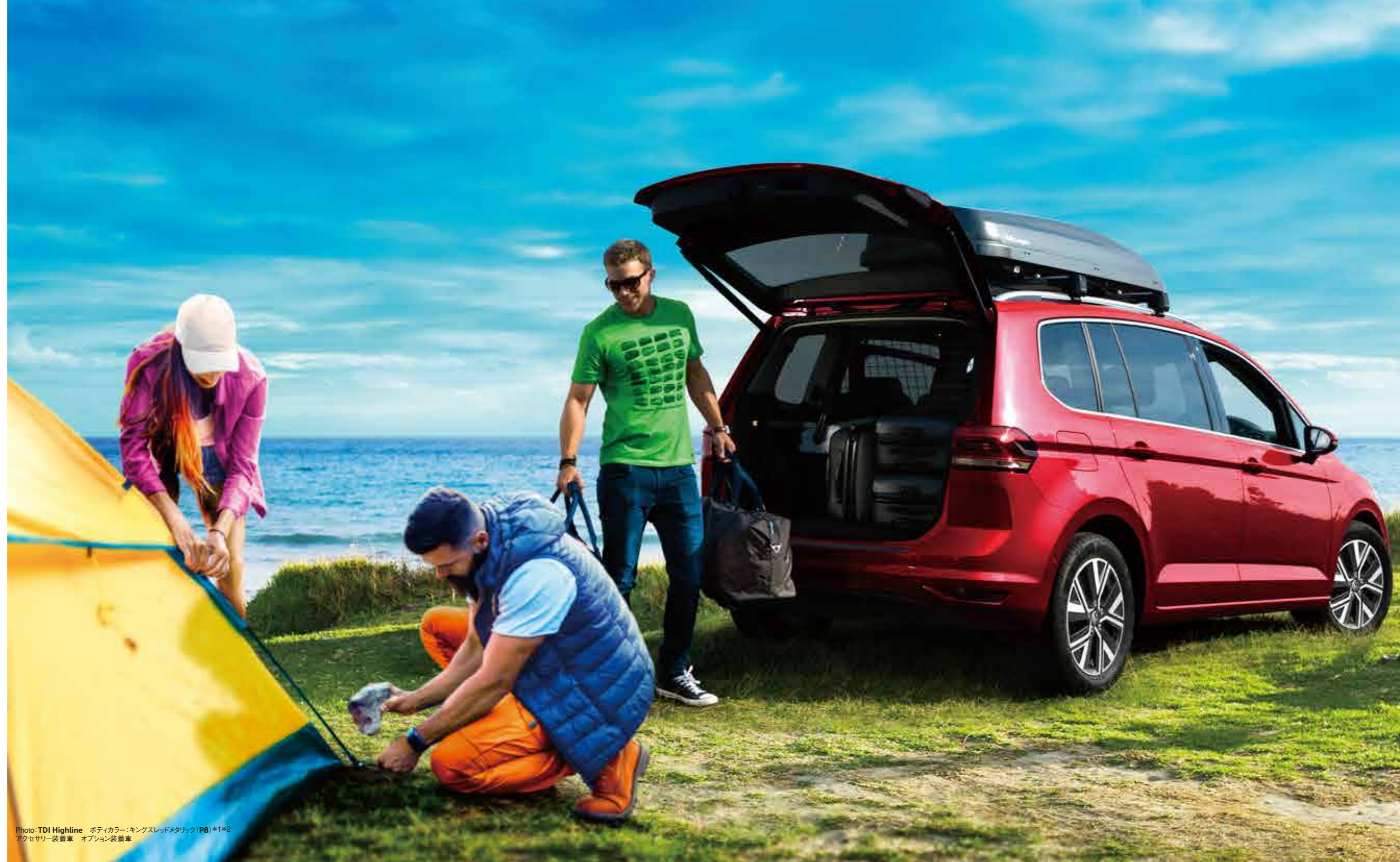
Photo:TDI Highline ボディカラー:キングスレッドメタリック (P8) *1*2 アクセサリ装着車 オプション装着車