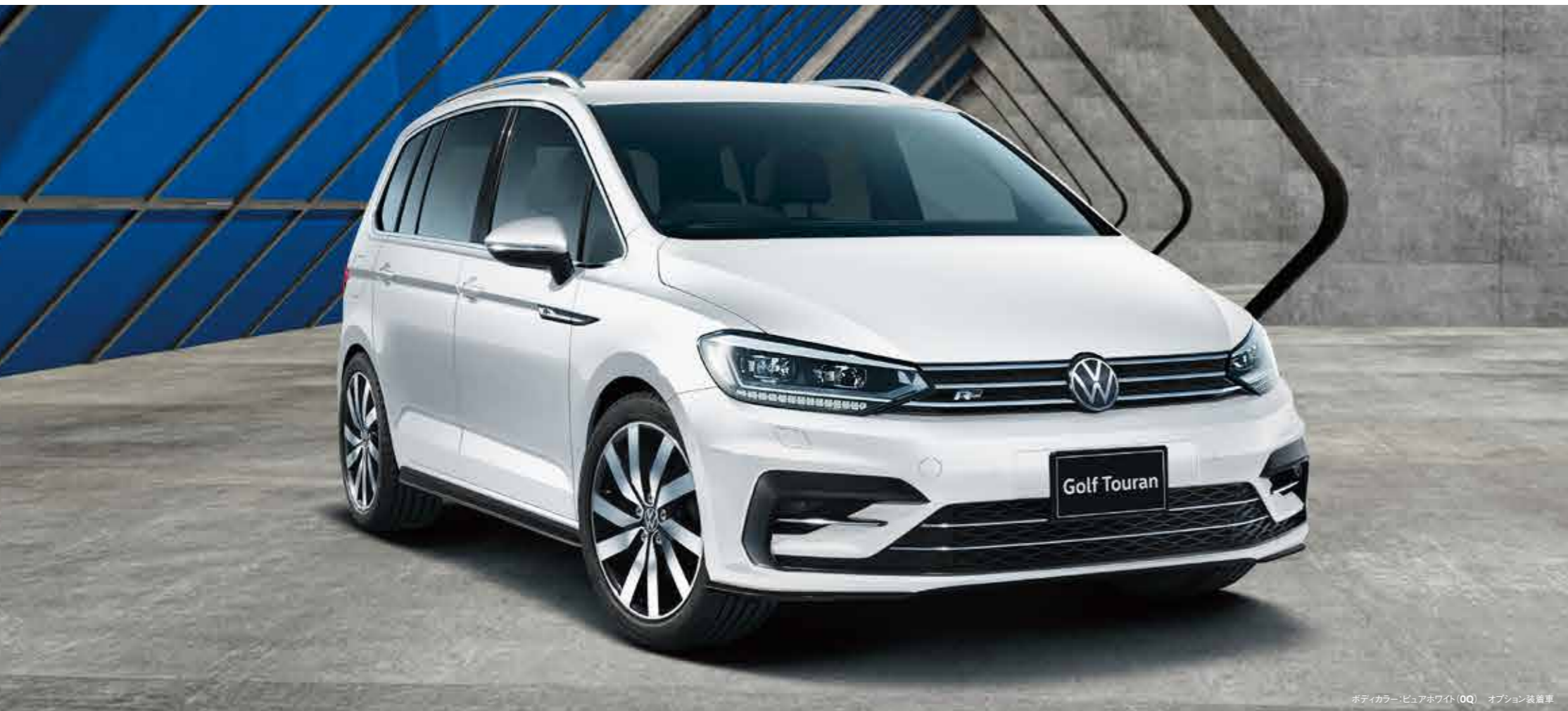
ボディカラー：ビュアホワイト (0Q) オプション装着車