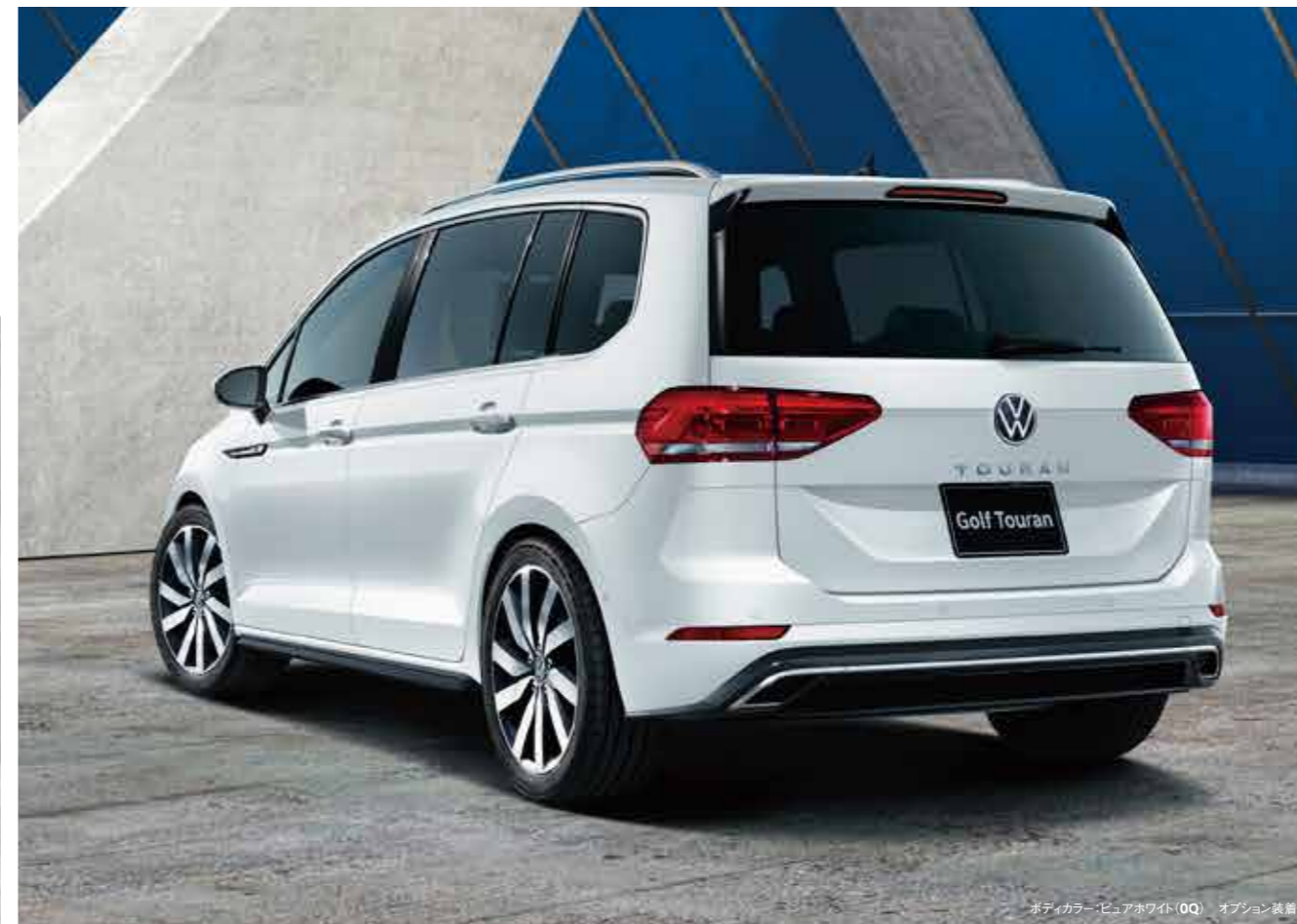
ボディカラー：ビュアホワイト (0Q) オプション装着車