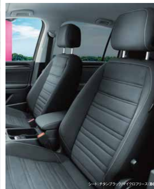
シート：チタンブラック/マイクロフリース (B6)