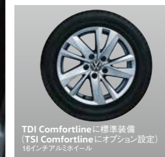
TDI Comfortlineに標準装備 (TSI Comfortlineにオプション設定) 16インチアルミホイール