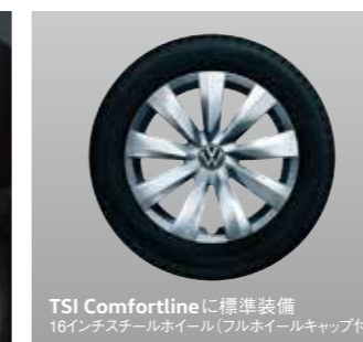
TSI Comfortlineに標準装備 16インチスチールホイール(フルホイールキャップ付)