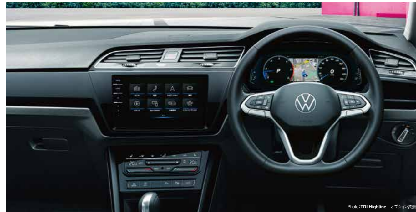
Photo:TDI Highline オプション装着車