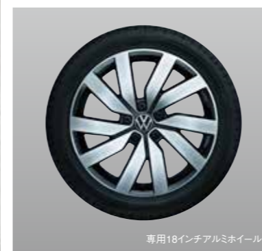
専用18インチアルミホイール