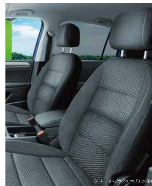
シート：チタンブラックファブリック(BG)