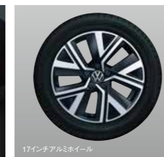
17インチアルミホイール