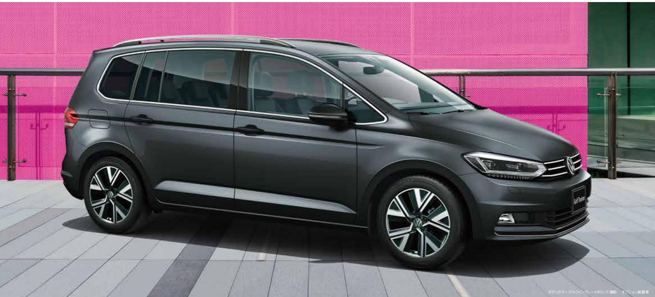
ボディカラー：ドルフィンブレイメタリック (B0) オプション装着車

ゴルフ トゥーランが持つさまざまな魅力を余すことなく楽しめるモデル。5スポークの17インチアルミホイールを採用し、エクステリアのスタイリッシュさをより際立たせました。インテリアでは、艶やかなピアノブラックのデコラティブパネルを配し、洗練と上質の空間を演出。さらには快適なドライブをサポートする“Keyless Access”、2列目左右席のシートヒーターやサンブラインド、そして先進安全技術の“Side Assist Plus”など、多彩な機能を標準装備しています。また、開放感あふれるオープンエアクルージングを楽しめる電動パノラマスライディングルーフをオプションで選択できます。