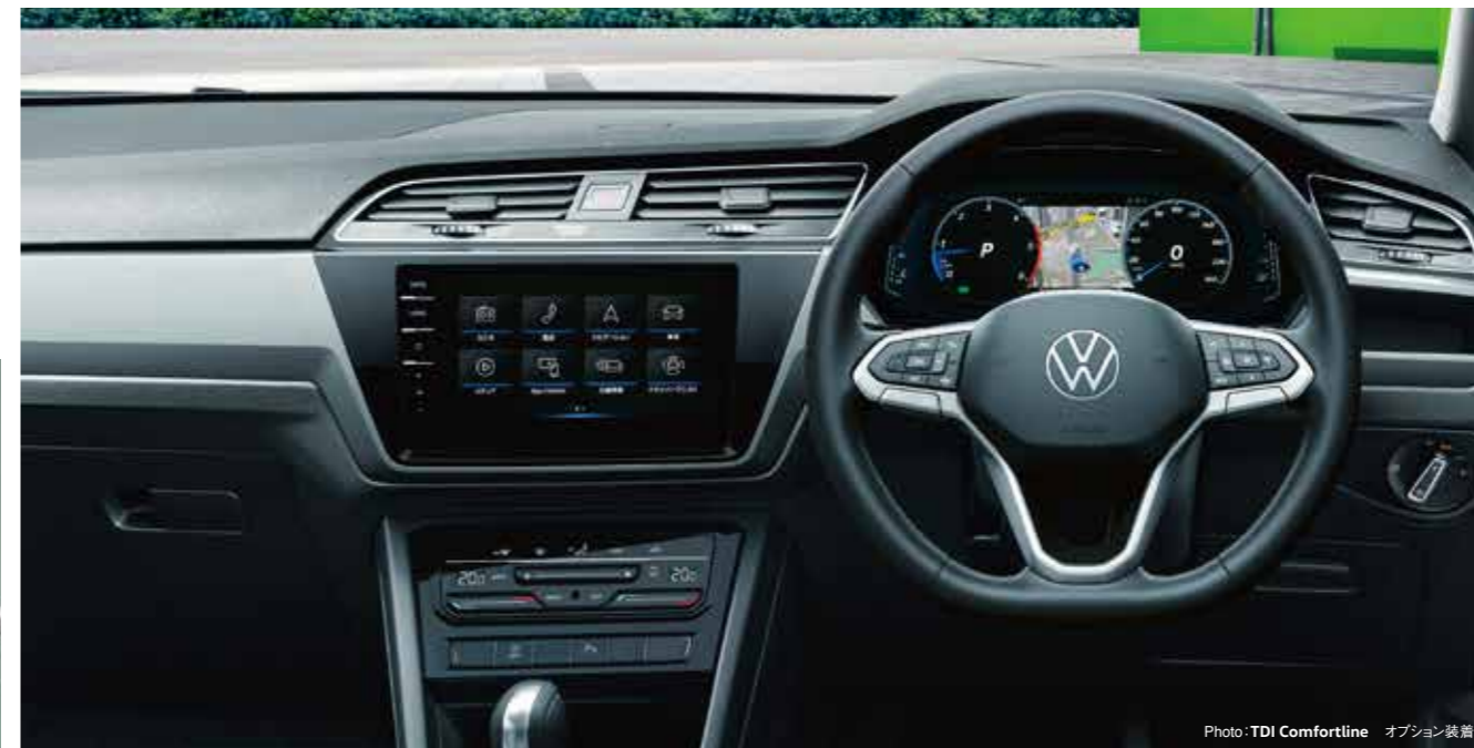
Photo: TDI Comfortline オプション装着車