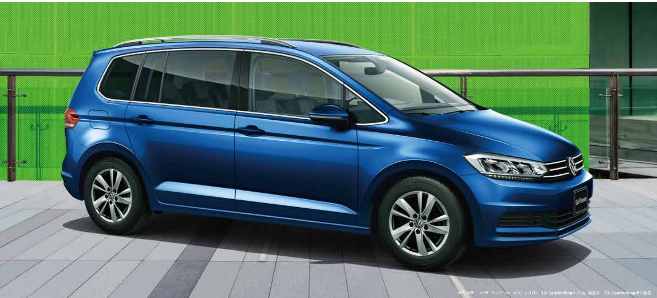
ボディカラー：アトランティックブルーメタリック(H7) TSI Comfortlineオプション装着車 TDI Comfortline標準装備

TSI Comfortline にも、アップグレードパッケージとしてオプション装着が可能です。