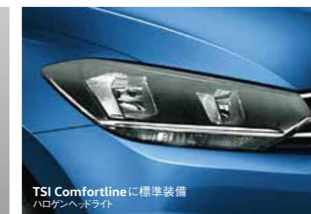
TSI Comfortlineに標準装備 ハロゲンヘッドライト